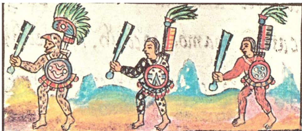
Figura 6. Guerreros aztecas. Códice florentino