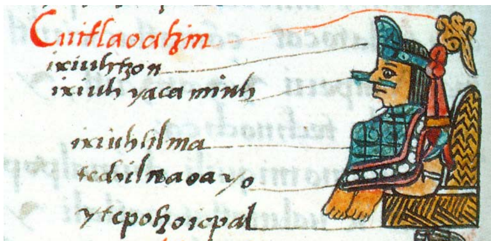
Figura 1. Cuitlahuatzin en su trono. Primeros memoriales