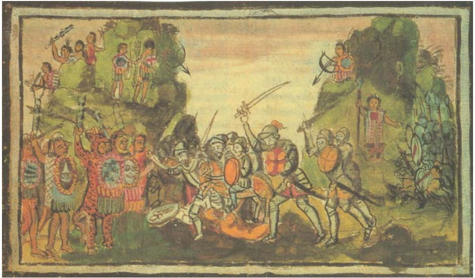
Figura 3. Batalla de Otumba o Tonanixpan. Diego Durán, Historia de la Indias de Nueva España