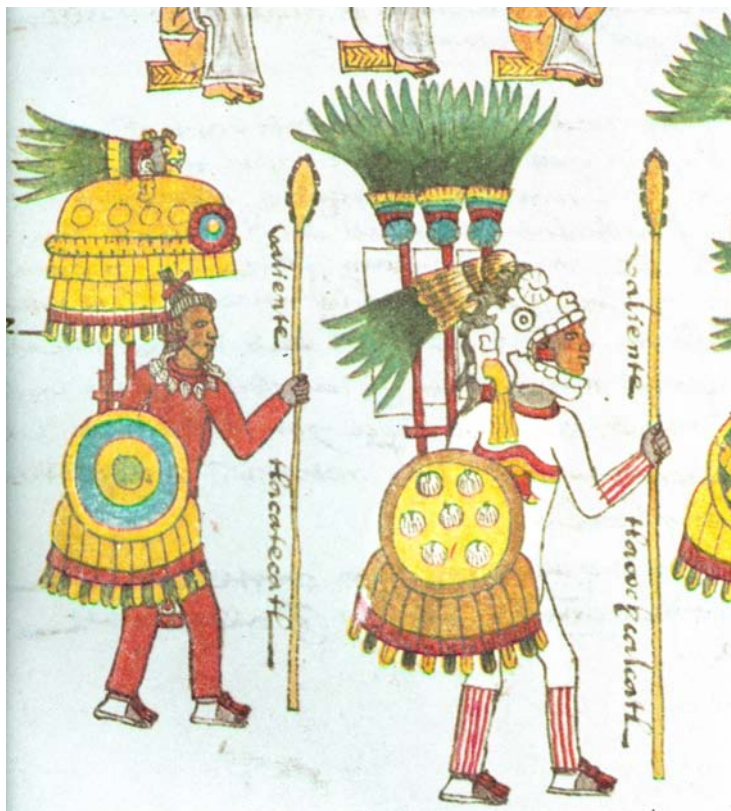
Figura 5. Jefes militares de las cuatro partes de la ciudad de Mexico-Tenochtitlan. Códice mendocino