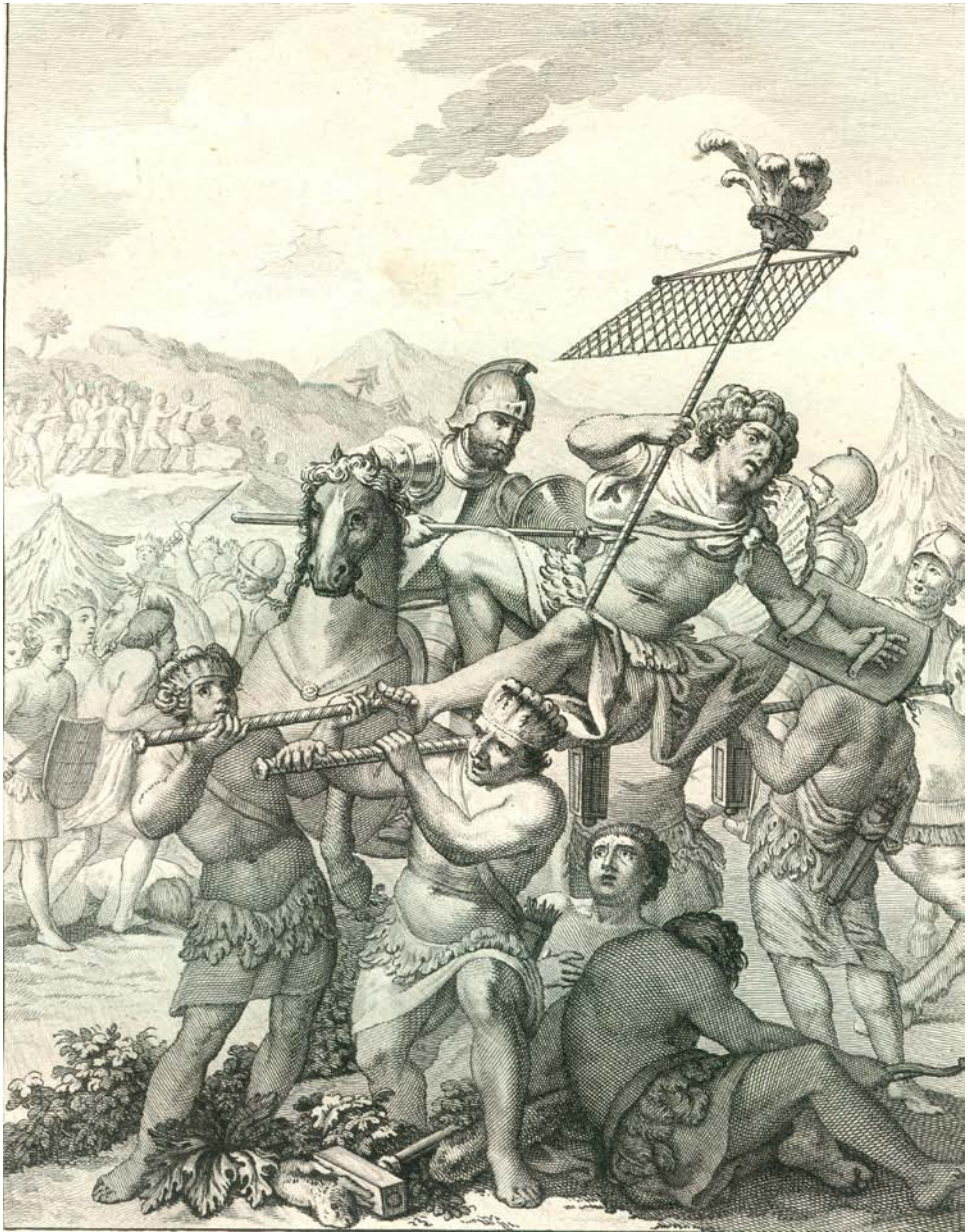
Figura 2. Batalla de Otumba donde quedan desechos y destruidos los mexicanos. Antonio de Solís, Historia de la conquista de México