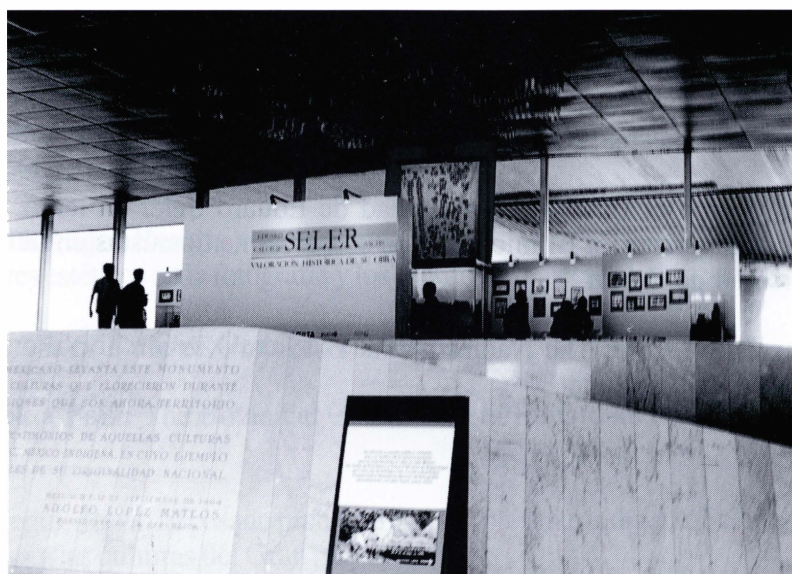
Imágenes de la exposición realizada en el marco del Coloquio “Eduard y Caecilie Seler: una valoración histórica de su obra” en el Museo Nacional de Antropología, del 23 de marzo al 25 de abril de 1999.