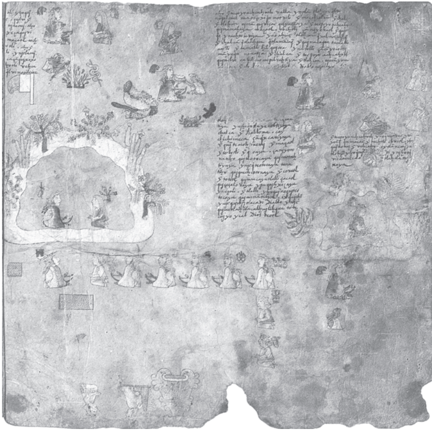
Figura 20. La interacción entre Tlotzin y los chalcas en el Mapa Tlotzin

Jurado que fue, y recibido en el imperio Tlotzin, una de las cosas en que más puso su cuidado fue el cultivar la tierra; y como en tiempo de su abuelo Xólotl lo más de él vivió en la provincia de Chalco, con la comunicación que allí tuvo con los chalcas y tultecas, por ser su madre su señora natural, echó de ver cuán necesario era el maíz y las demás semillas y legumbres, para el sustento de la vida humana; y en especial lo aprendió de Tecpoyo Achcauhtli que tenía su casa y familia en el peñol de Xico: había sido su ayo y maestro, y entre las cosas que le había enseñado, era el modo de cultivar la tierra, y como persona habituada a esto, dio orden de que en toda la tierra se cultivase y labrase [...] 156