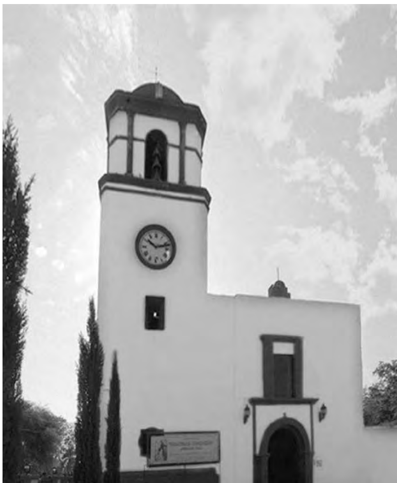
San Lorenzo del Jaumave. Gobierno del Estado de Tamaulipas