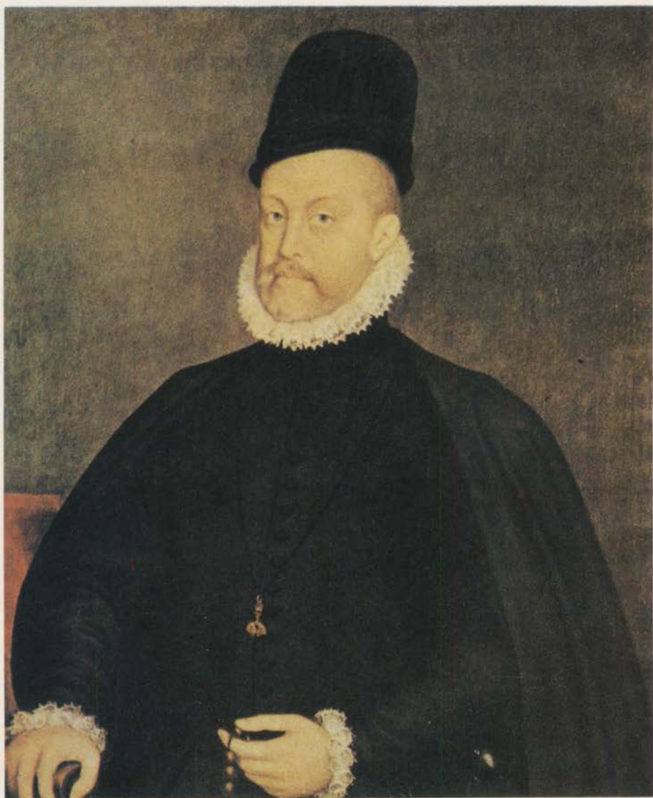
Felipe II por C. Coello