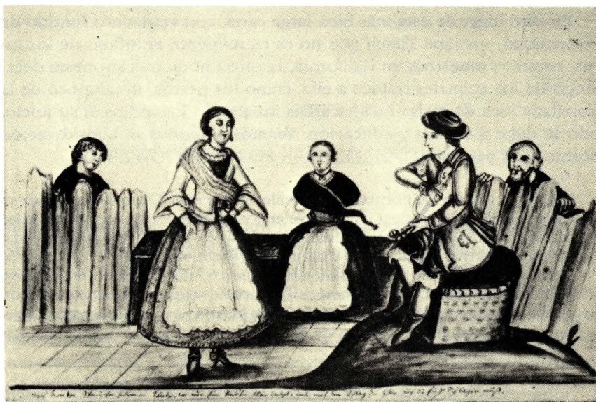
Una fiesta de criollos, dibujados por el jesuita Ignacio Tirsch.

pues no tiene especial tripita o estómago porque no tiene más que un canutillo que, desde la boca, penetra al remate de su cuerpecito. Y así, cuanto es el meneo de tragar, tanto es el despedimiento de lo tragado, lo que se ve en la tripita: lluvia de su excremento. 7