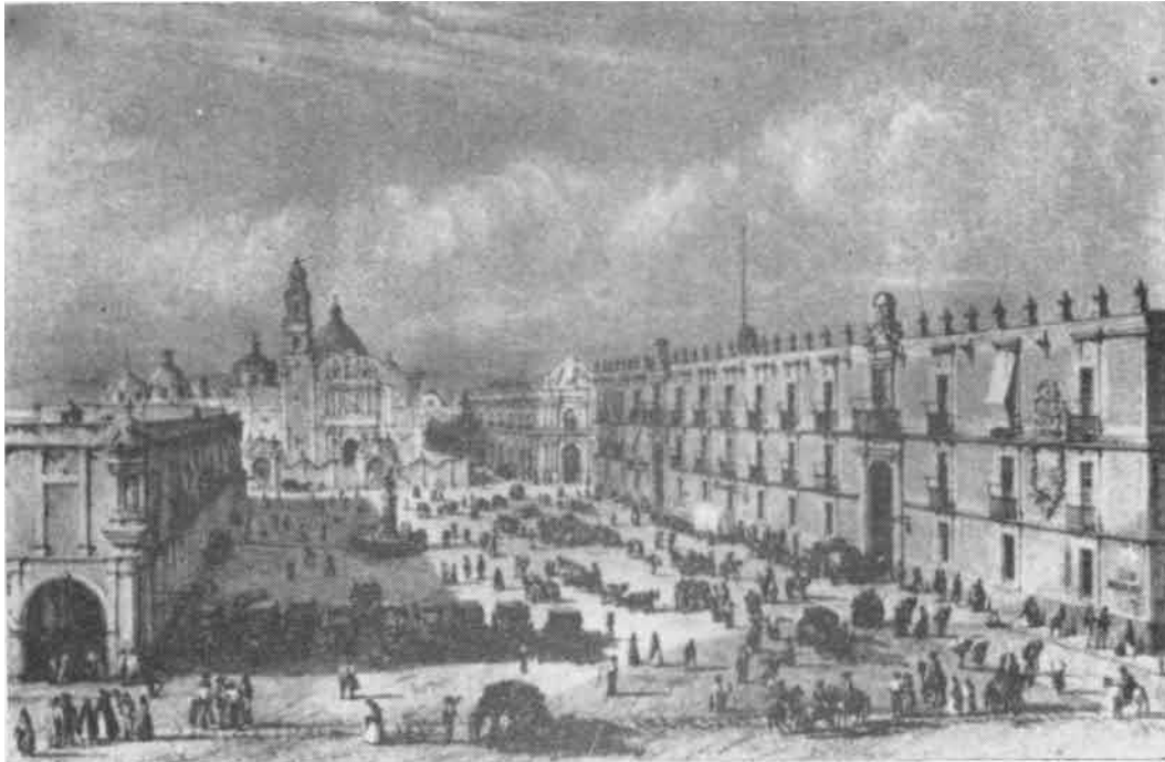
LA ANTIQUA PLAZA DE SANTO DOMINGO (MÉXICO EN EL TIEMPO)