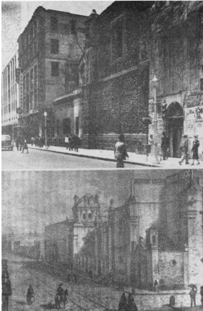
TRANSFORMACIÓN DE LA CALLE DE SANTA CLARA (MÉXICO EN EL TIEMPO)