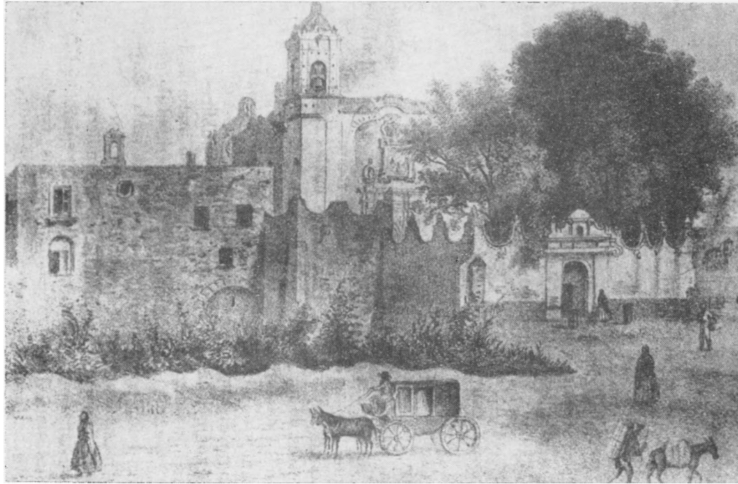
LA IGLESIA DE SAN COSME (MÉXICO EN EL TIEMPO)