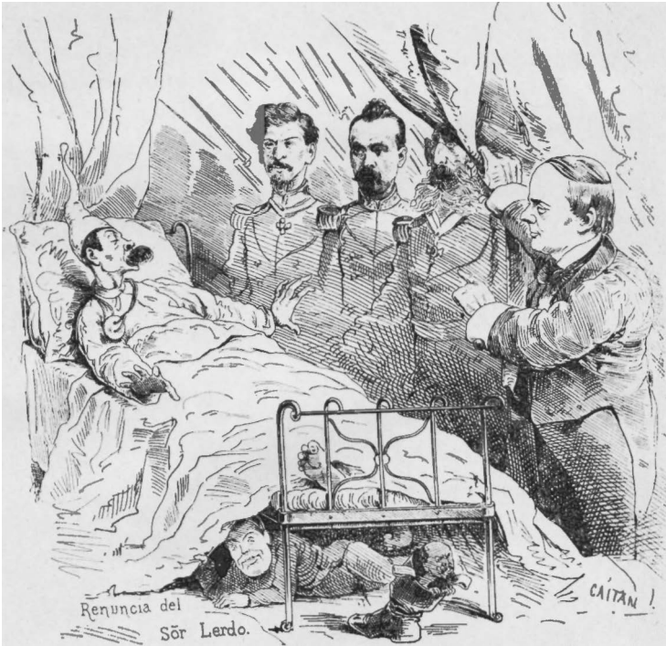
“LA CANTÁRIDA” DE 5 DE DICIEMBRE DE 1877. CARICATURIZADOS DÍAZ, LERDO, ESCOBEDO, GARCÍA (?), VILLARREAL (?). LA LEYENDA: “PESADILLA TUXTEPECANA”