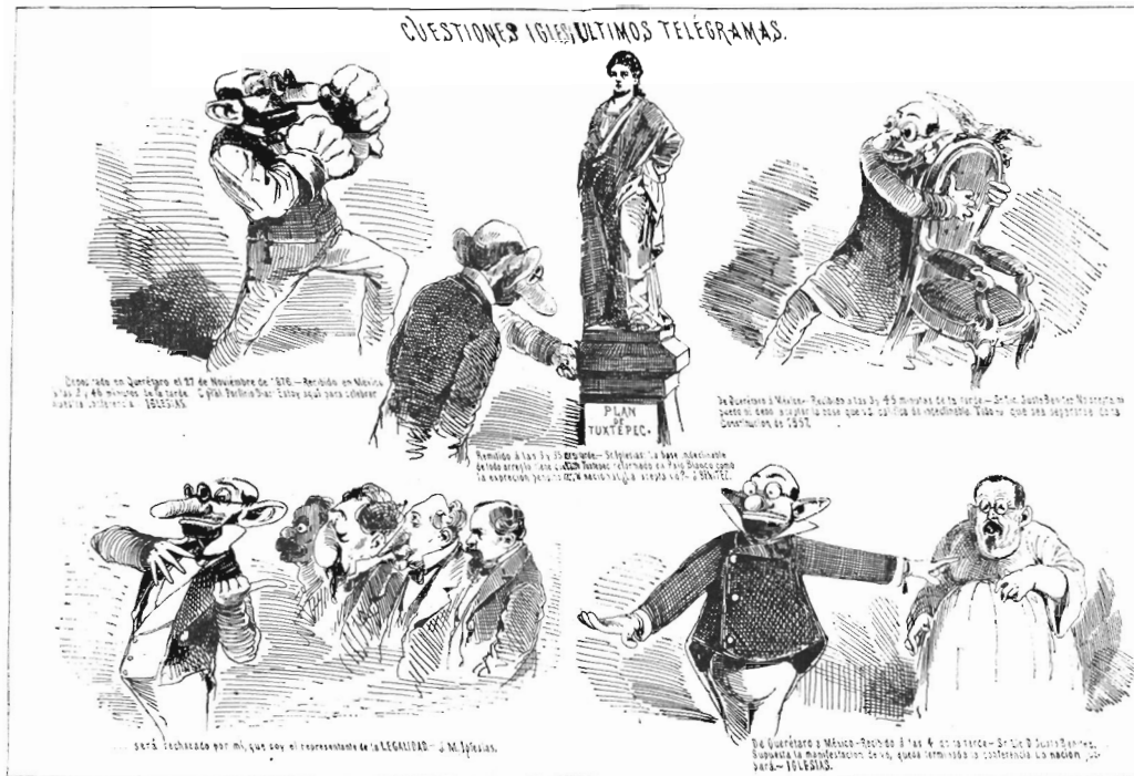
"EL AHUIZOTE" DE DICIEMBRE 8 DE 1876. CARICATURIZADO DON JOSÉ MARÍA IGLESIAS. SIN PIE