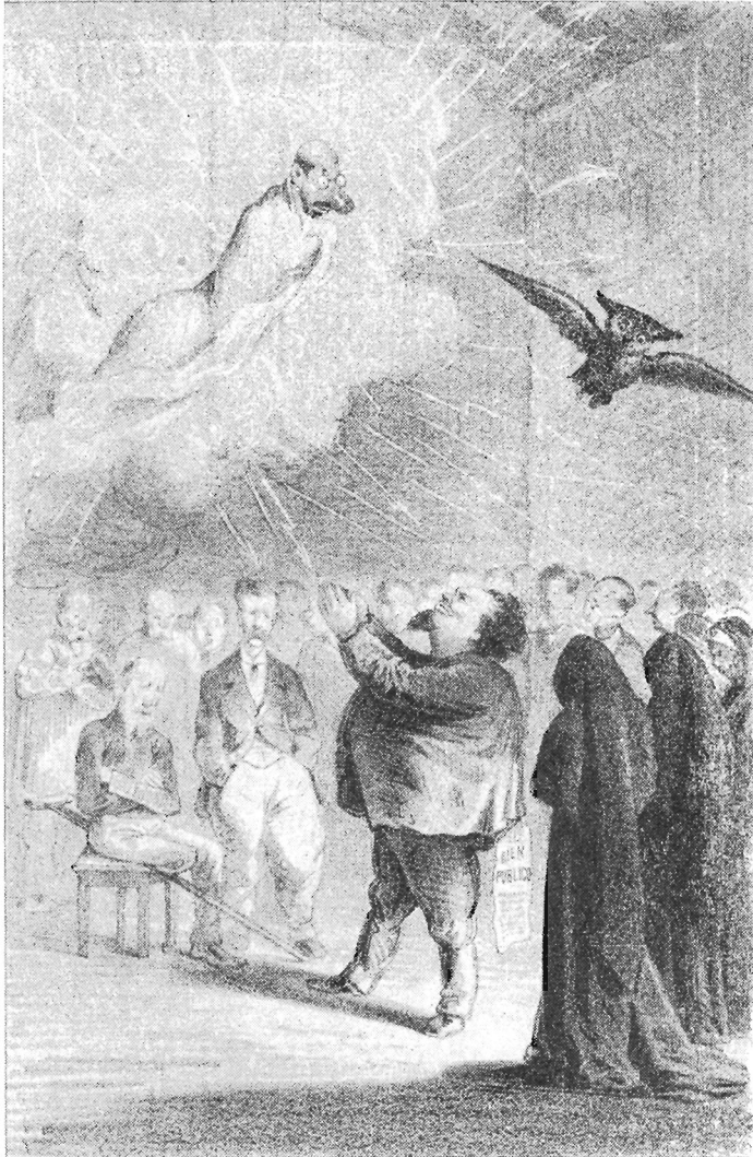
"El Tecolote" DE SEPTIEMBRE 3 DE 1876. CARICATURIZADOS DON JUSTO SIERRA Y DON JOSÉ MARÍA IGLESIAS. EL PIE: "UNA SESIÓN ESPÍRITA"