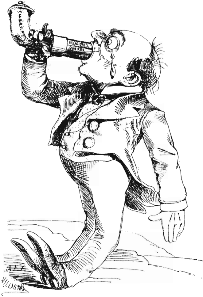
"El Ahuizote" de SEPTIEMBRE 1º de 1876. CARICATURIZADO DON SEBASTIÁN LERDO DE TEJADA. EL PIE: "FINIS CORONAT OPUS"