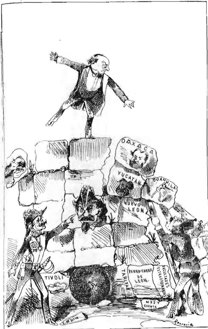
"El Jicote" DE FEBRERO 3 DE 1876. CARICATURIZADOS LERDO, EL GENERAL MEJÍA, (?). EL PIE: "EL GOBIERNO DE LOS PUNTALITOS"