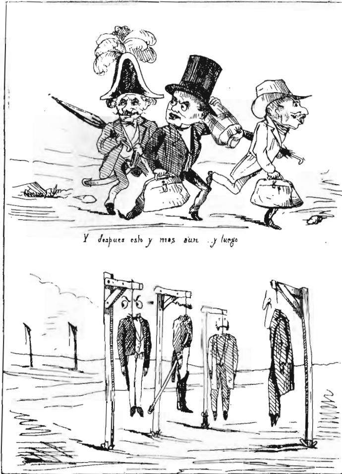
“EL CASCABEL” DE 27 DE FEBRERO DE 1876. CARICATURIZADOS LERDO Y SU GABINETE EL PIE: “UN FINAL TRISTE... VEDLO” (II)