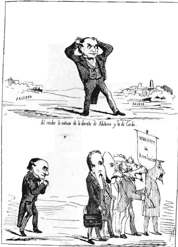
“EL CASCABEL.” DE 27 DE FEBRERO DE 1876. CARICATURIZADOS LERDO Y SU GABINETE. EL PIE: “LO QUE SERÁ...” (I)