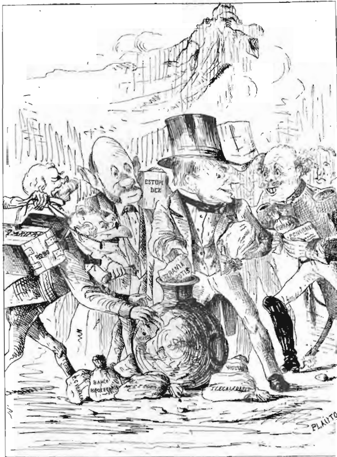
"El Cascabel" de 30 de enero de 1876. CARICATURIZADOS EL PRESIDENTE LERDO Y SU GABINETE. EL JUE: "...AYER CARGABAN (II)