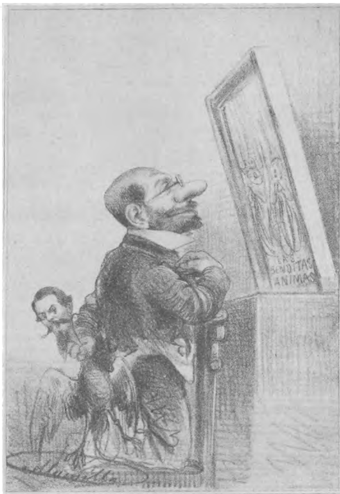
El Padre Cojos de 24 de mayo de 1874. Caricaturizados los licenciados don José María Iglesias y don Ignacio L. Vallarta (?). El pie: "ESTUDIO CONSTITUCIONAL.—YO SÓLO BUSCO LA TRANQUILIDAD DE MI CONCIENCIA"