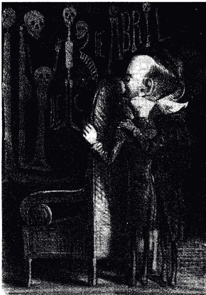
CARICATURA DE LA ORQUESTA DE 5 DE NOVIEMBRE DE 1870. CARICATURIZADOS: JUÁREZ Y LERDO. EL PIE: "NO OS PODÉIS QUEJAR DE MI, | VOSOTROS A QUIEN MATÉ; | SI BUENA VIDA OS QUITÉ; | NI UNA SEPULTURA OS DÍ"