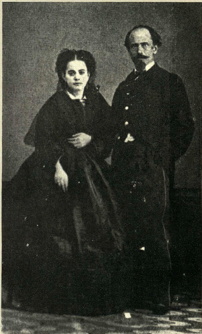
EL GENERAL TOMÁS O'HORÁN CON SU ESPOSA. OFRECIÓ LA ENTREGA DE LA CAPITAL DE LA REPÚBLICA, PREVIAS CAPITULACIONES.