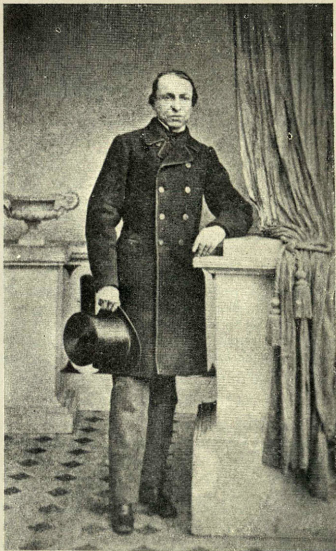
GENERAL RAMÓN TAVERA, QUIEN RINDIÓ LA PLAZA DE MÉXICO AL GENERAL DÍAZ