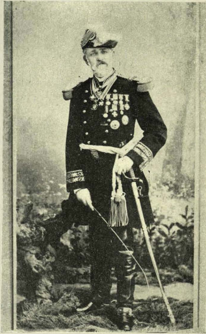
GENERAL FELIPE BERRIOZABAL.