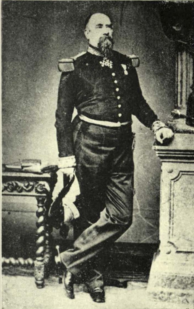
GENERAL NEIGRE, UNO DE LOS JEFES DE LAS FUERZAS INVASORAS.