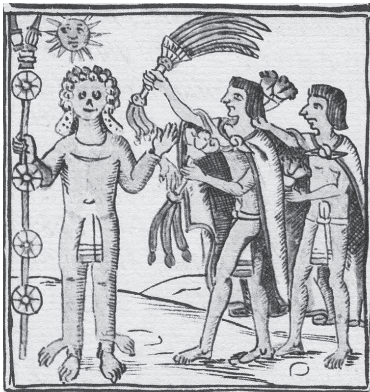
Figura 15.7. Xipes limosneros. Códice florentino , lib. II, f. 21

Vestidos con las pieles de los hombres desollados que habían representado a los dioses, los limosneros se veían de alguna manera divinizados, por lo que la gente accedía a darles comida y diversas prendas de vestir. Tenían también el poder de transmitir energía vital, lo que hacían a cambio de alguna limosna: