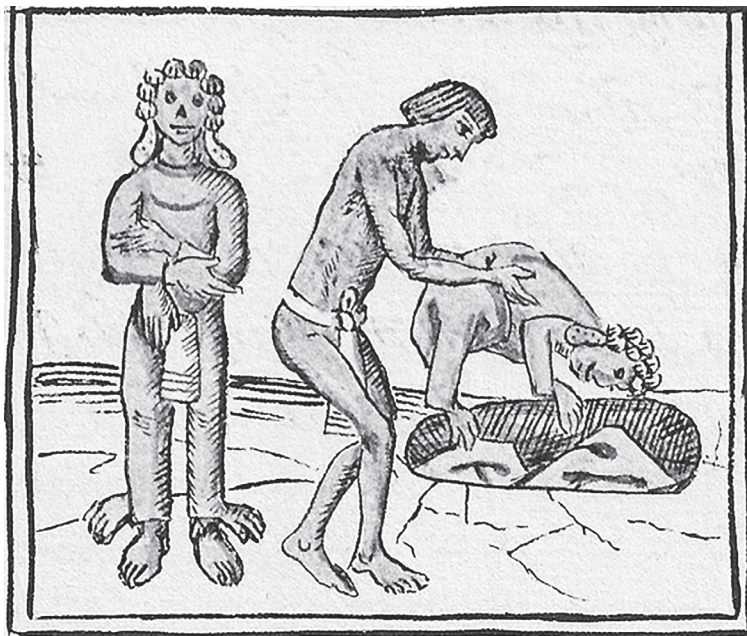
Figura 15.8. Enterramiento de pieles. Códice florentino , lib. II, f. 26r.

quitaba y ponía. Enterrábanlos con canto y solemnidad, como a cosa sagrada; al cual entierro acudía toda la tierra a sus templos”. 31