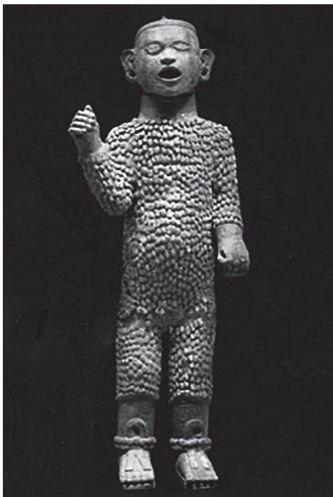
Figura 15.3. Xipe Tótec procedente de Xolalpan. Museo Nacional de Antropología