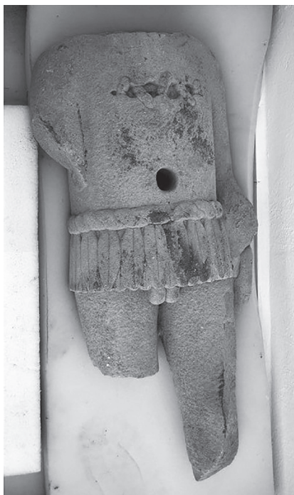
Figura 15.2. Representación de Xipe Tótec. Zapotitlán de las Salinas