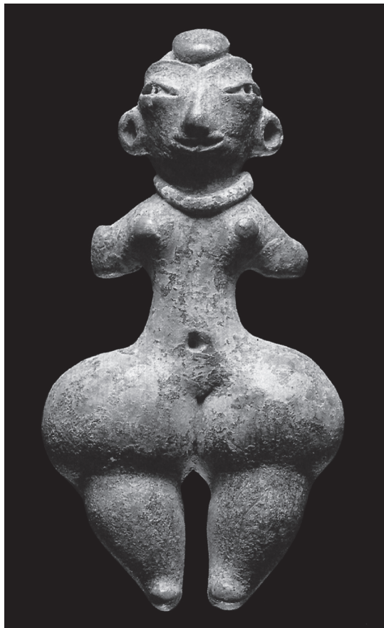
Figura 15.6. Muslo y fecundidad. Preclásico, Tlatilco, Estado de México, Museo Amparo, Puebla

Cintéotl, era mancebo el cual llevaba puesto por carátula el pellejo del muslo de la mujer que había muerto, y juntábase con su madre”. 23