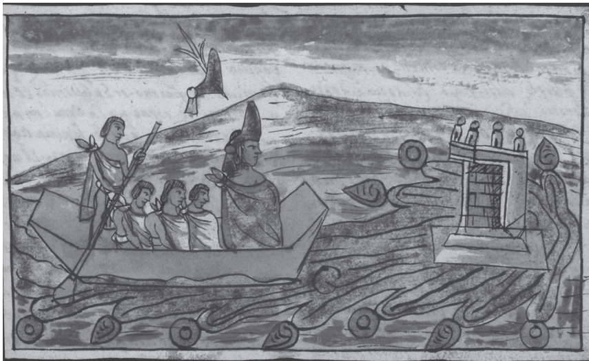
Figura 15.9. Tlachtonco . Códice Durán , t. II, lám. 52

y dióles cuatro canastas envueltas que las llevarsen allá; lleváronlas luego, que sería a media noche, y les dijo a todos los corcobados y enanos, adrezaos todos, y vamos, que han de venir por nosotros y a dejarnos a México Tenochtitlan, e iremos a Cincalco a la casa de Huémac: luego comenzaron a llorar los corcobados y enanos- Díjoles: no llores, que para siempre viviremos a placer y contento, y no habrá memoria de muerte, y así con esto se embarcaron en las canoas y fueron a dar a Tlachtonco en medio de la laguna, que fueron los corcobados y enanos remando hasta allá. 38