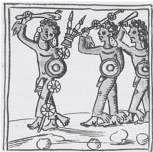
Figura 15.4. Rito de xipes con pieles de hombres desollados. Códice florentino , lib. II, f. 20r.