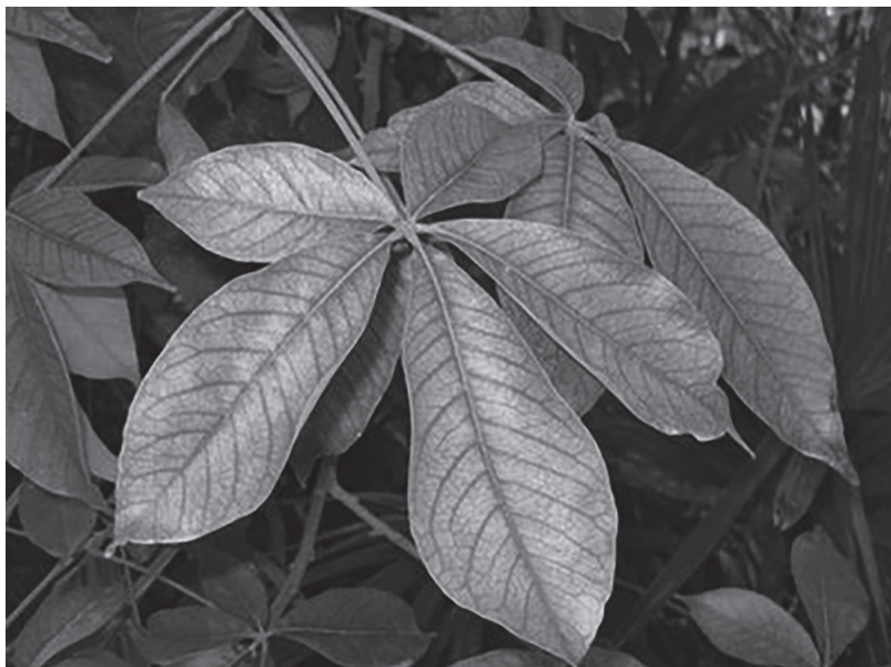
Figura 15.5. Hojas de zapote blanco.

Las hojas de zapote (figura 15.5), las mazorcas de maíz, las flores y el pulque al parecer constituían los paradigmas esenciales en la parafernalia de este dios.