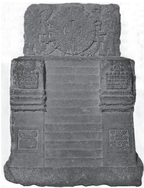
Figura 10.2. Teocalli de la guerra sagrada. Museo Nacional de Antropología