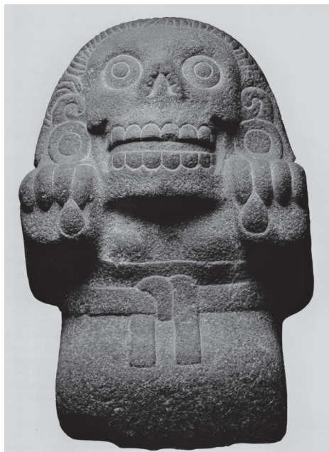
Figura 10.7. Cihuateteuh . Museo Nacional de Antropología

Ma xontlamati in cualcan, in iec- can in monan, in mota in tonatiuh ichan. In ompa ahuialo, in huella- macho, in pacoa, in netlamachtilo. 22