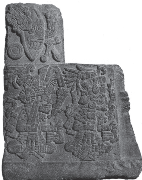
Figura 10.4. 1-Técpatl (1-Pedernal), el nombre calendárico de Huitzilopochtli. Teocalli de la guerra sagrada. Museo Nacional de Antropología