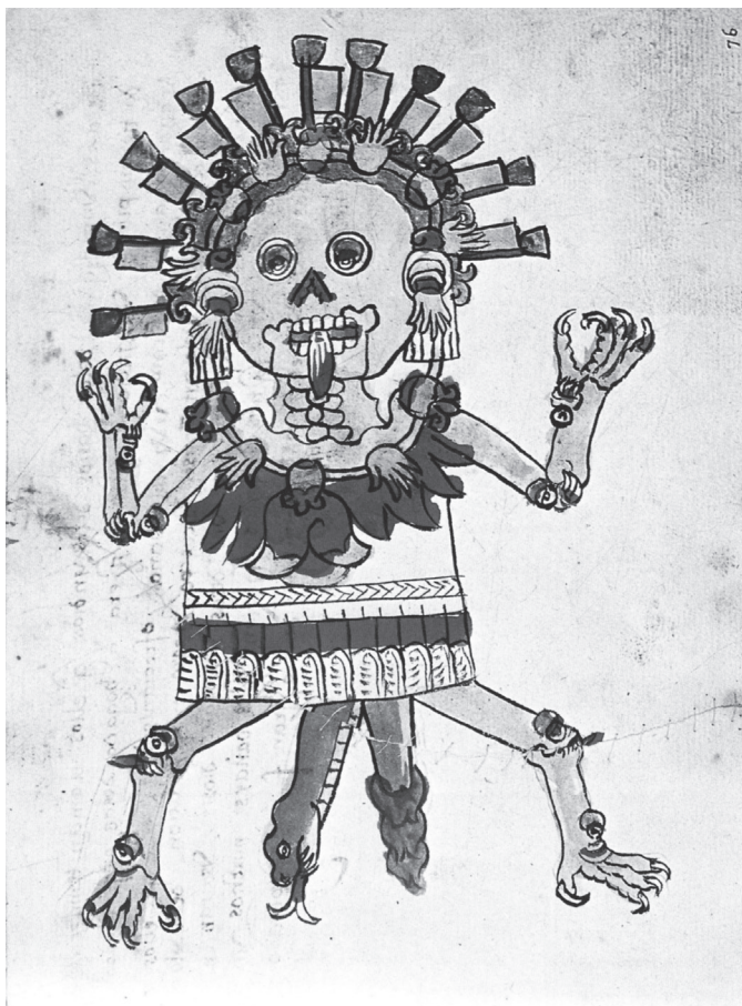
Figura 10.9. Tzitzimitl. Códice magliabechiano , lám. 76

por la que corría la sangre o donde se cautivaban ofrendas humanas para el techcatl del templo. Por otra parte, el hecho de que el acto sexual se considerara un combate erótico entre el varón y la mujer, que la mujer victoriosa consiguiera un prisionero y que el embarazo subsecuente fuera también una guerra con valor sacrificial sugiere que la guerra florida tenía a su vez un matiz erótico.