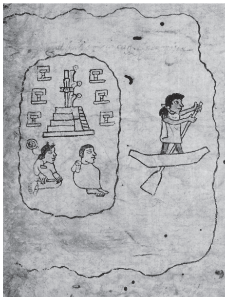
Figura 10.1. Agua y fuego en el templo de Aztlan. Códice Boturini , lám. I (detalle)