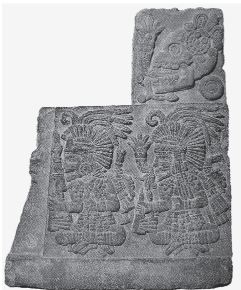
Figura 10.3. 1-Miquiztli (1-Muerte), el nombre calendárico de Tezcatlipoca. Teocalli de la guerra sagrada. Museo Nacional de Antropología