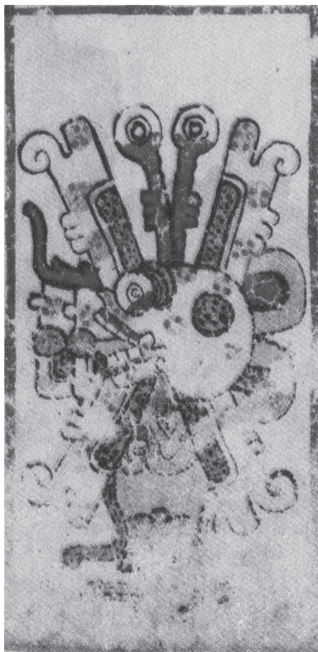
Figura 10.6. Xochiyaoyotl , la guerra florida. Códice Borgia , lám. 7

sucedido mal, que no por eso se le había de dejar de hacer la fiesta y solemnidad que convenía; que se diese orden de ir a otra entrada para traer hombres para sacrificar. Y es el caso que en semejantes solemnidades no podían sacrificar otra gente, si no era habida en guerra.