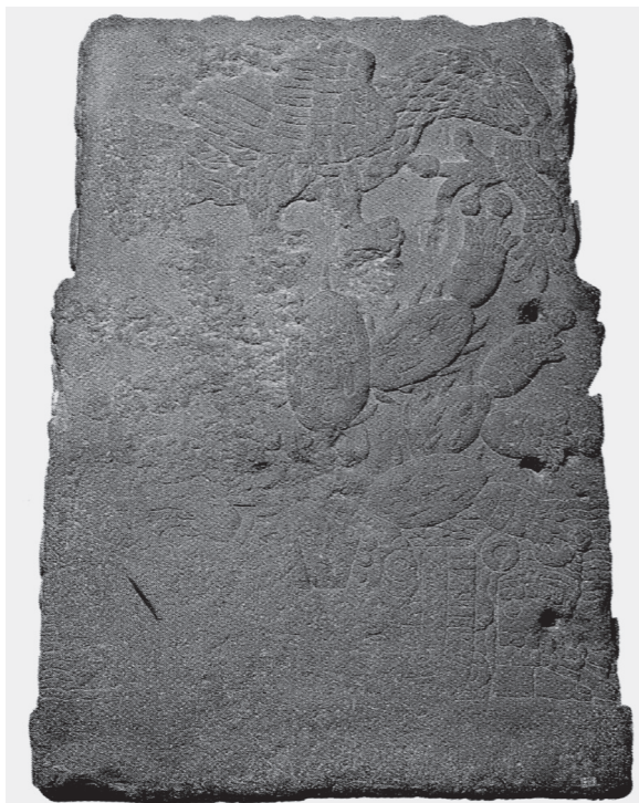
Figura 10.5. El águila sobre el nopal. Teocalli de la guerra sagrada. Museo Nacional de Antropología

y Motecuhzoma Xocoyotzin flanquean al sol, a izquierda y derecha, respectivamente. De la boca de ambos salen el agua y el fuego. 4