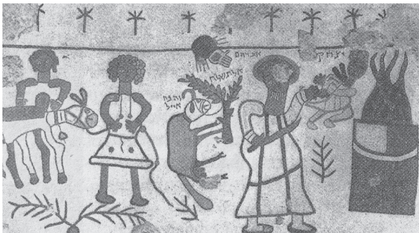
Figura I.3. El sacrificio de Isaac. Iglesia visigoda de San Pedro de la Nave (El Campillo), Zamora, España