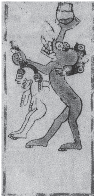
Figura I.5. “Mictlantecuhtli tiene sed de nosotros”. Códice Borgia , lám. 6

náhuatl precolombina. Tanto la palabra antigua ( huehuetlahtolli ) como adagios ( machiotlahtolli ) y los cantos líricos ( xochicuicatl ) que llegaron hasta nosotros son prueba fehaciente de ello. Por otra parte, según lo establecemos en el segundo capítulo, la cognición indígena tal como se estructuraba en tiempos prehispánicos permitía regular de manera funcional el intercambio con el mundo exterior 15 en sus aspectos más sutiles: objetivaba pulsiones recónditas y las canalizaba fuera del cuerpo colectivo.