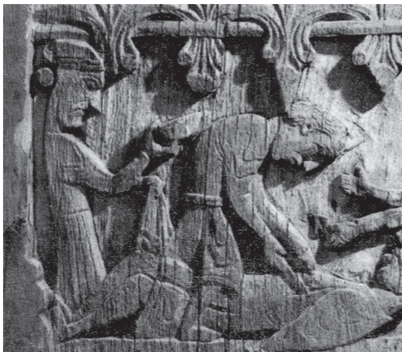
Figura I.4. Sacrificio del héroe mitológico noruego Högni. Iglesia de Hylestad, Noruega