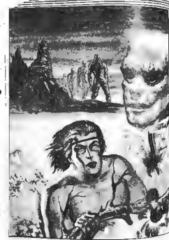
Figura 2. Portada interior.