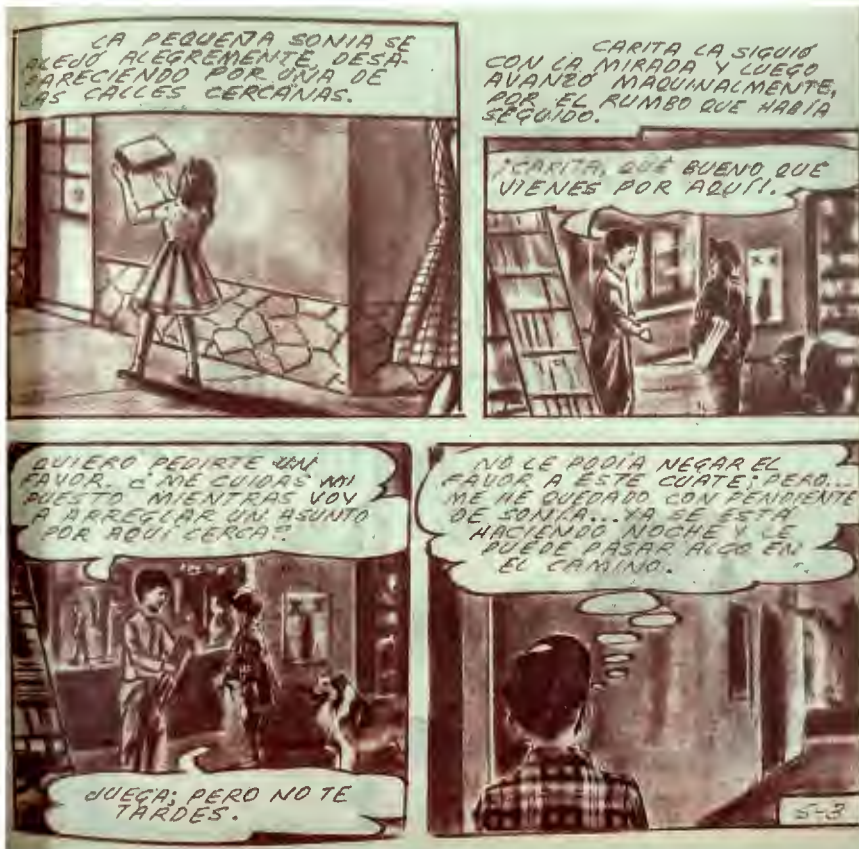
Lámina 5.