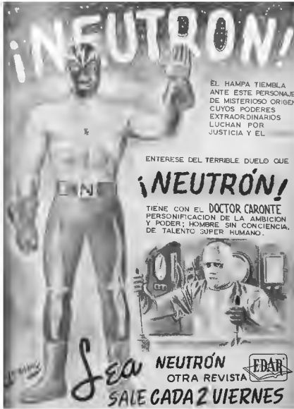
Figura 1. Contraportada.