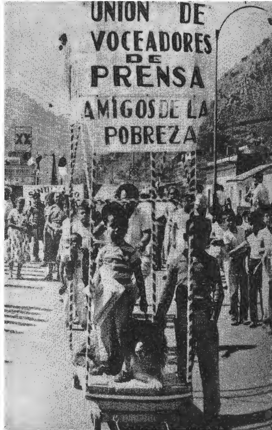
Figura 3. Contraportada.

ningún modo crítico hacia la precaria situación en la que, durante el primer lustro de la década de los años sesenta, se encontraban 27038625 de mexicanos, 16 y en cambio sugería que la pobreza no era una condición que debía rechazarse, que supusiera algún tipo de dominación, o que resultara intolerable. De la pobreza se podía ser incluso amigo , y