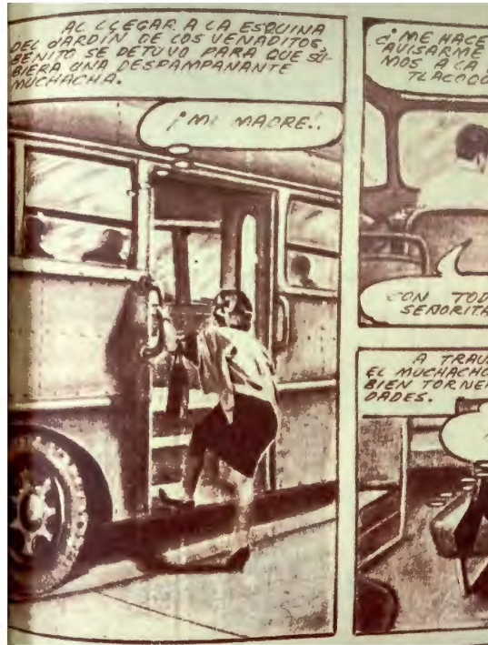
Lámina 1. Amigos de la Pobreza , n. 6, 4 de enero de 1962, p. 23