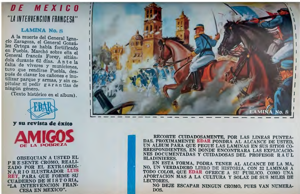
Lámina 2. Contraportada.