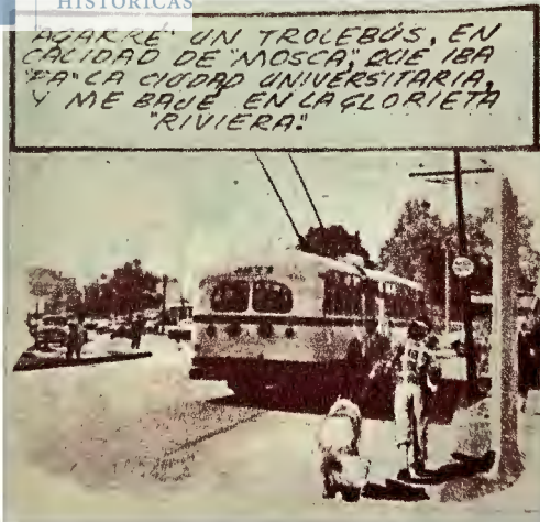
Lámina 3.