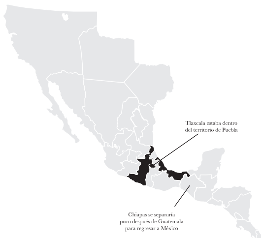
MAPA 5 TRES TERRITORIOS CON ESCOCESES Y GUADALUPES EN LA JUNTA NACIONAL INSTITUYENTE (elaboración propia)