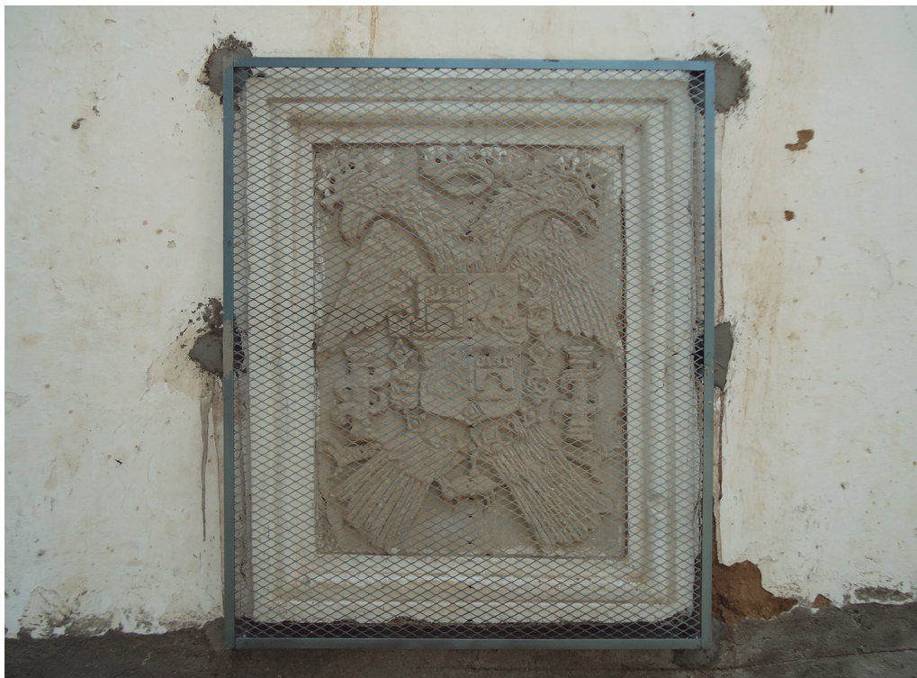
Figura 1. Escudo del Cacicazgo de Huitzo. Fotografía de la autora tomada durante un recorrido de campo el 20 de septiembre de 2014