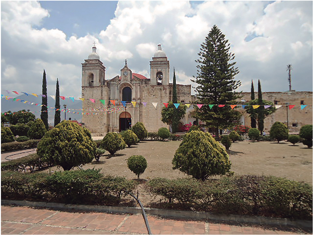
Figura 2. Convento de San Pablo Etla en Villa de Etla. Fotografía de la autora tomada durante un recorrido de campo el 5 de enero de 2011