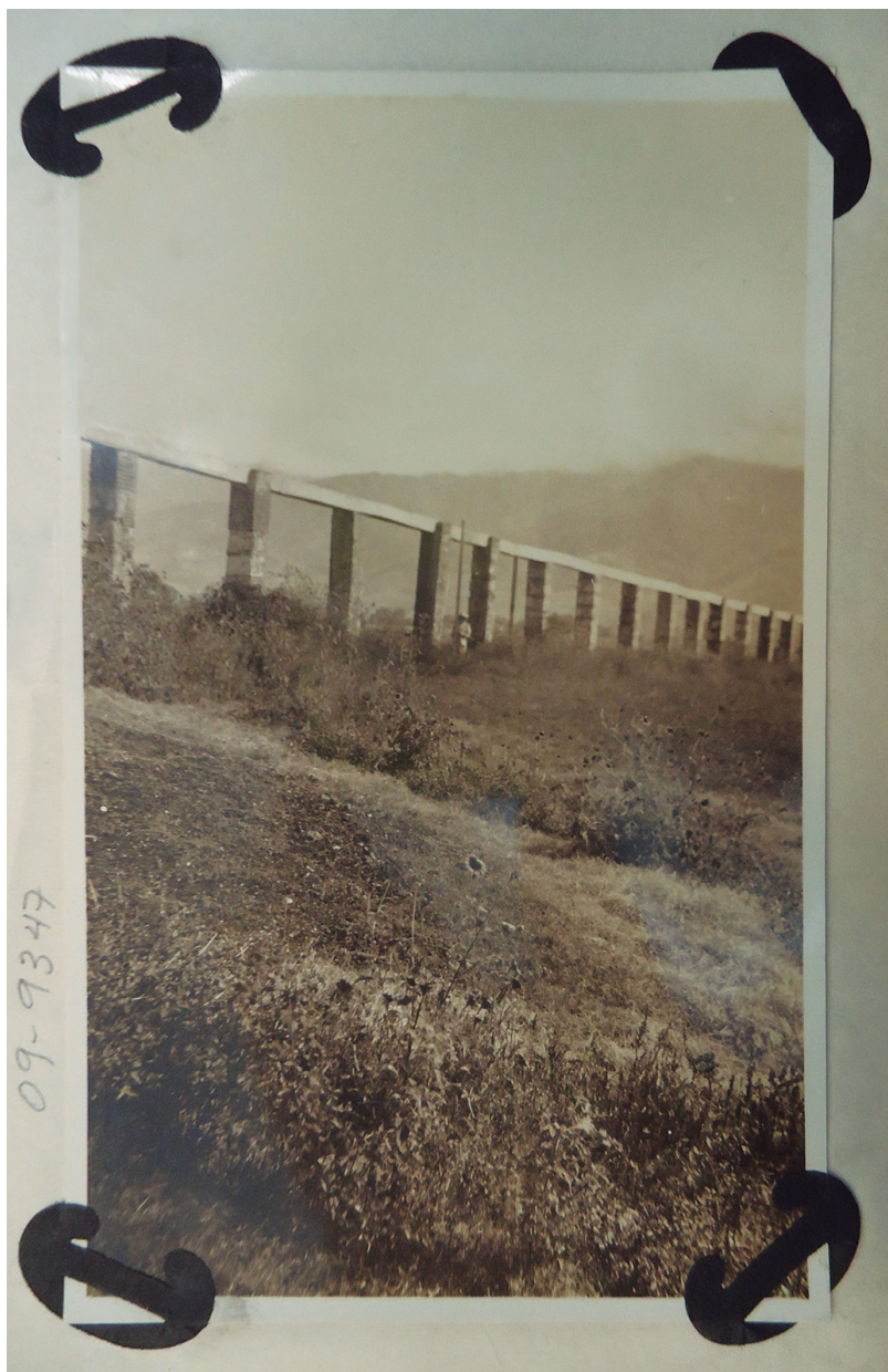
Figura 1. Acueducto de la Hacienda Viguera, 1919. Archivo Histórico y Biblioteca Central del Agua, Ciudad de México, Aprovechamientos Superficiales , c. 2764, exp. 38673