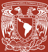
Imagen: Códice Florentino.

El presente trabajo tiene como objetivo central analizar y entender las múltiples relaciones que, desde mucho antes de sucumbir, establecieron los nahuas entre sí y frente a su entorno social y natural con el fin de producir sus propios medios de subsistencia y los modos de alcanzarlos. El complejo conjunto de objetos y acciones, de ideas y creencias, de saberes y experiencias que implicó ese antiguo y singular proceso, quedó en gran medida contenido en los numerosos escritos de muy diversa índole que los mismos iniciadores de la conquista material e ideológica de los pueblos indígenas redactaron al tiempo que intentaban dominar la lengua y el pensamiento de los vencidos.