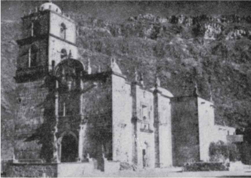
Vista de conjunto de la iglesia de la misión de San Javier, edificada por el padre Miguel del Barco y concluida en 1758.