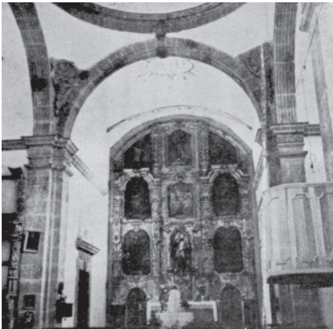
El retablo barroco del altar mayor de la misión de San Javier, traído de México por disposición del padre Del Barco. Fotografía de Jorge Gurría Lacroix