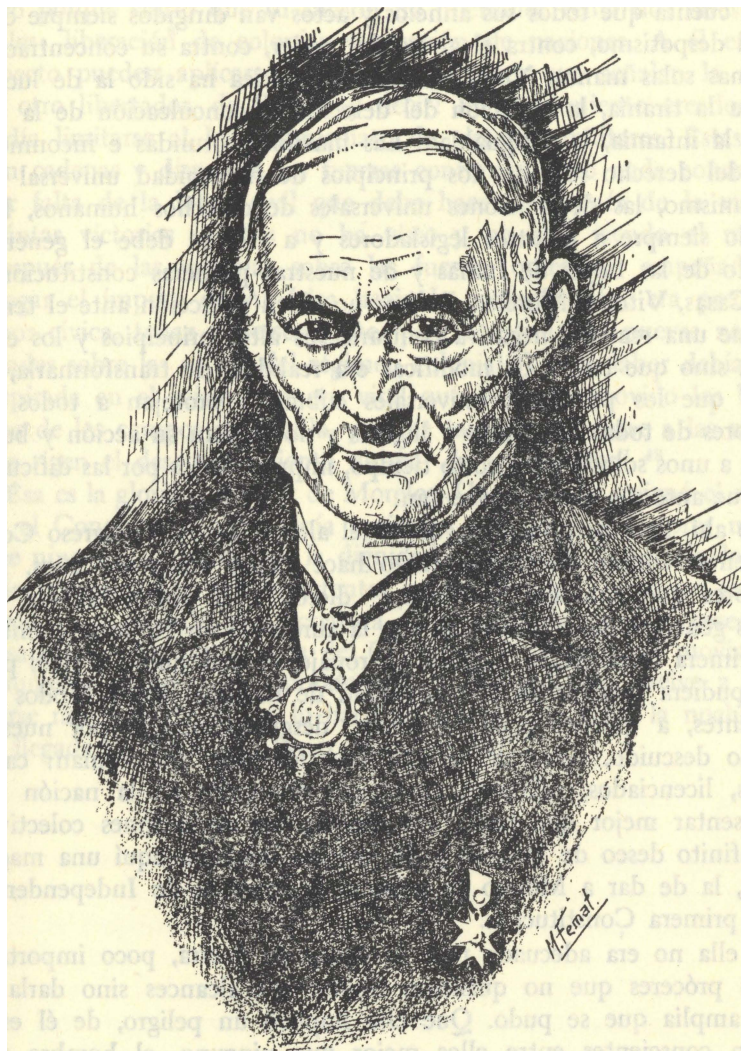
ANDRÉS QUINTANA ROO