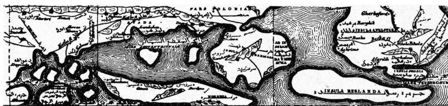
Fig. 2. Hojas 2, 3 y 4 de la Tabula Itineraria Edrisiana (A. D. 1154) (LELEWEL, Atlas, planche XII ).

En ella aparece, frente a la costa septentrional de Europa, un grupo de islas, entre ellas la que en la correspondiente y contemporánea Tabula Itineraria Edrisiana , aparece bajo el nombre de Norbeza (Noruega):