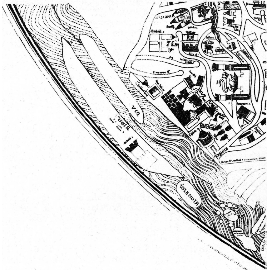
Fig. 3. Fragmento del Mapamundi de Erbstorf (ca. 1284) (MILLER, Mappaemundi , vol. V) (Cortesía de la Biblioteca de la Universidad de California, en Berkeley).

representaciones de los países escandinavos, como islas. En el mapa de Escandinavia y Groenlandia, tomado de un ms. Ptolomaeus del siglo XV, conservado en la Biblioteca Laureniana de Florencia, y reproducido en el Periplus de Nordenskiöld, Suecia y Noruega aparecen claramente como una isla, separada del continente 350 Pedro Aliaco, poco explícito es cierto, en el lugar correspondiente