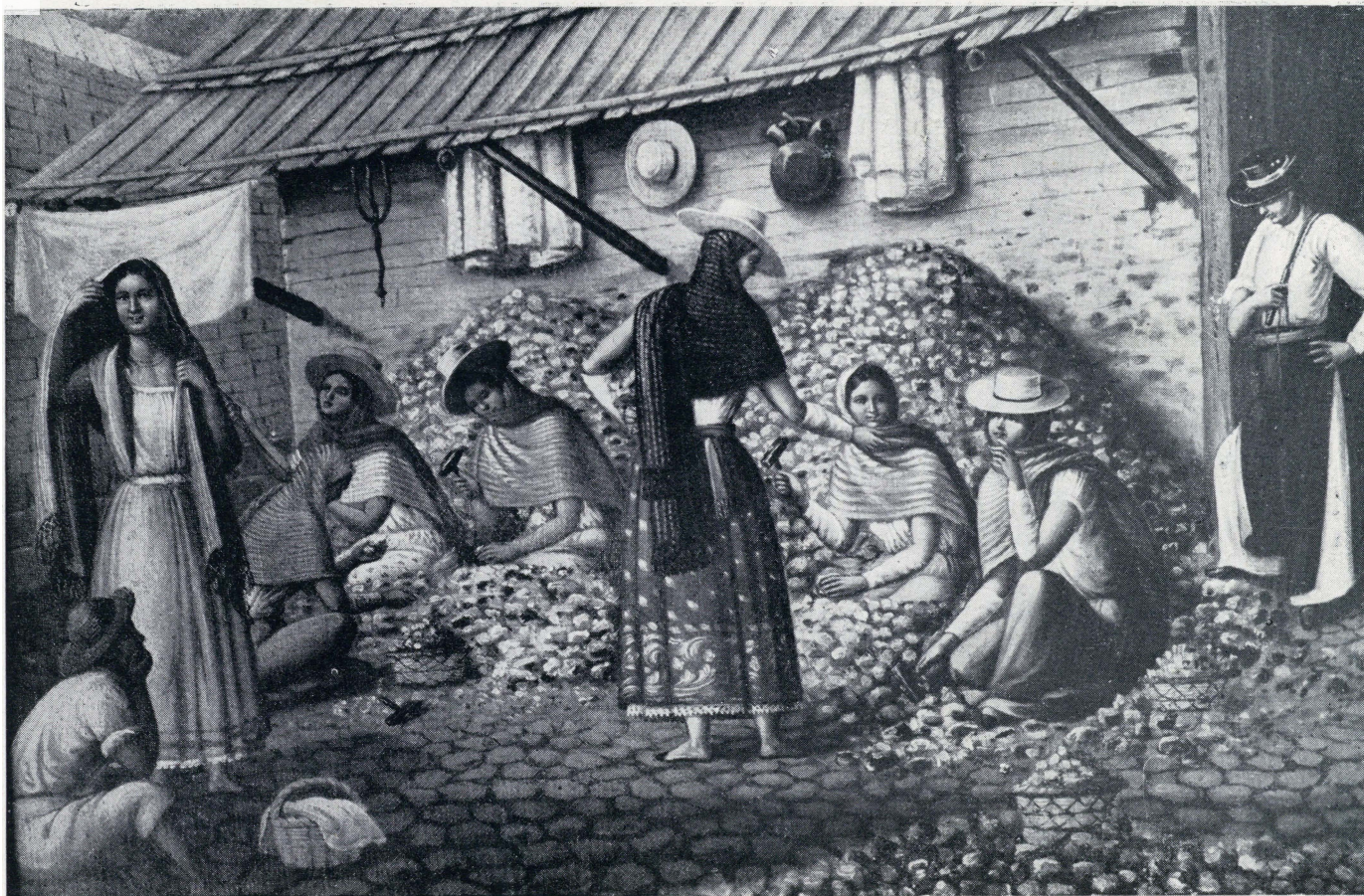
Quebradoras de metal en Guanajuato—Oleo anónimo, principios del siglo XIX. (MUSEO NACIONAL DE HISTORIA)