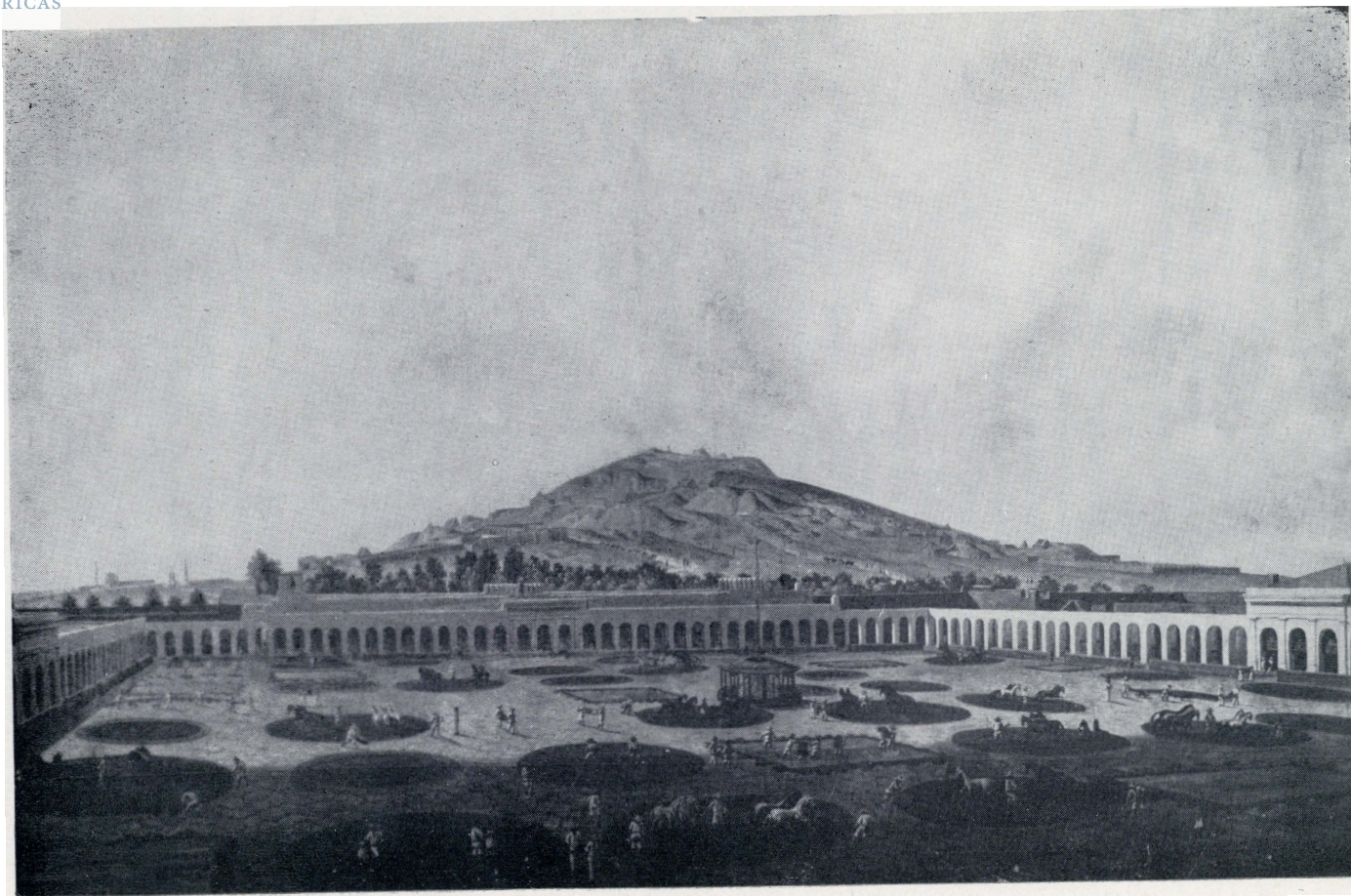
Hacienda de Beneficio Minero. Pintura por Pedro Gualdi.—Siglo XIX.