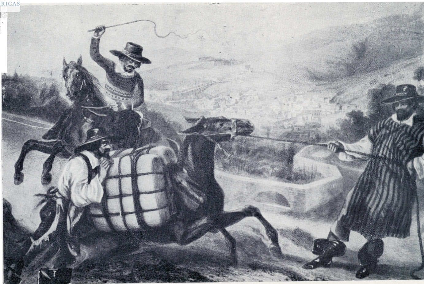
Arrieros e camión de Dolores a Guajuato, principios del siglo XIX.